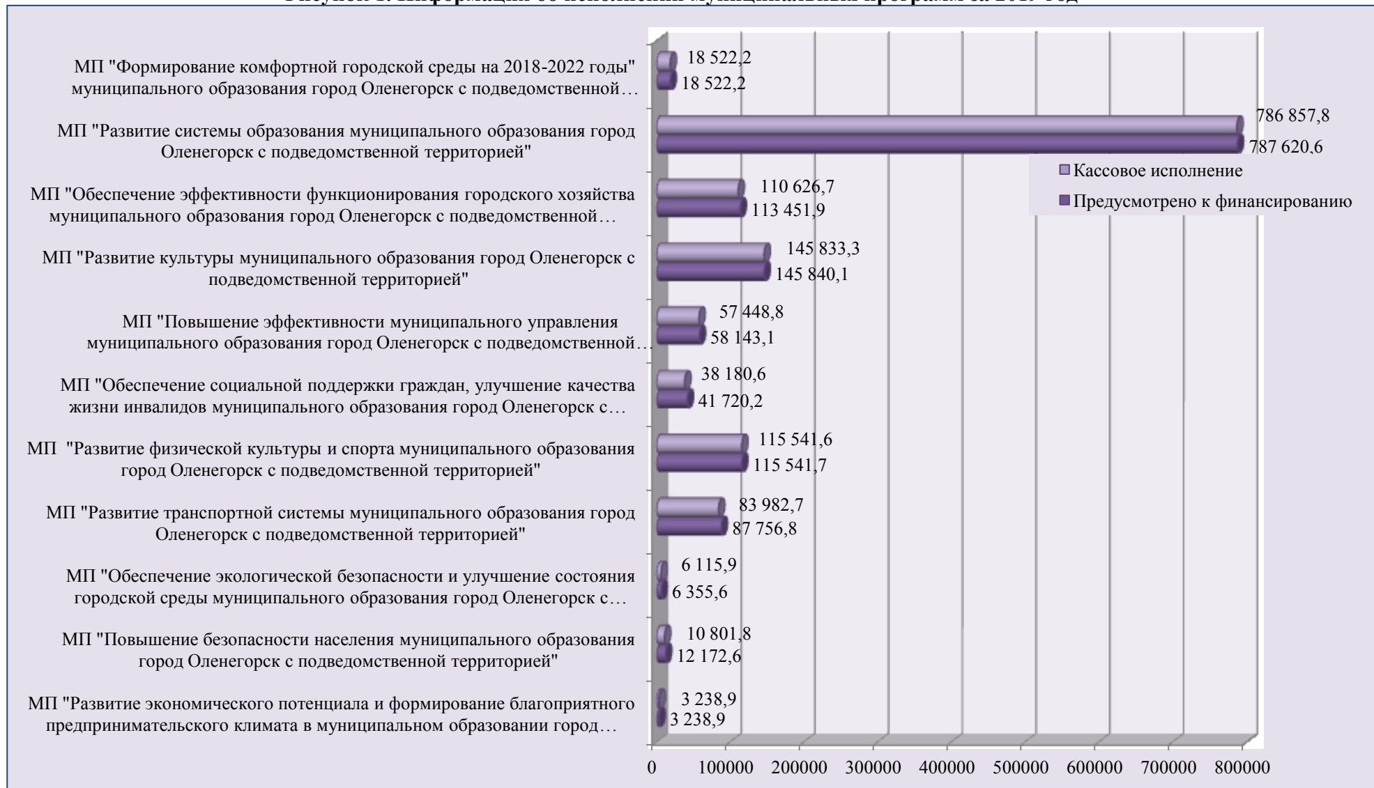
Рисунок 1. Информация об исполнении муниципальных программ за 2019 год