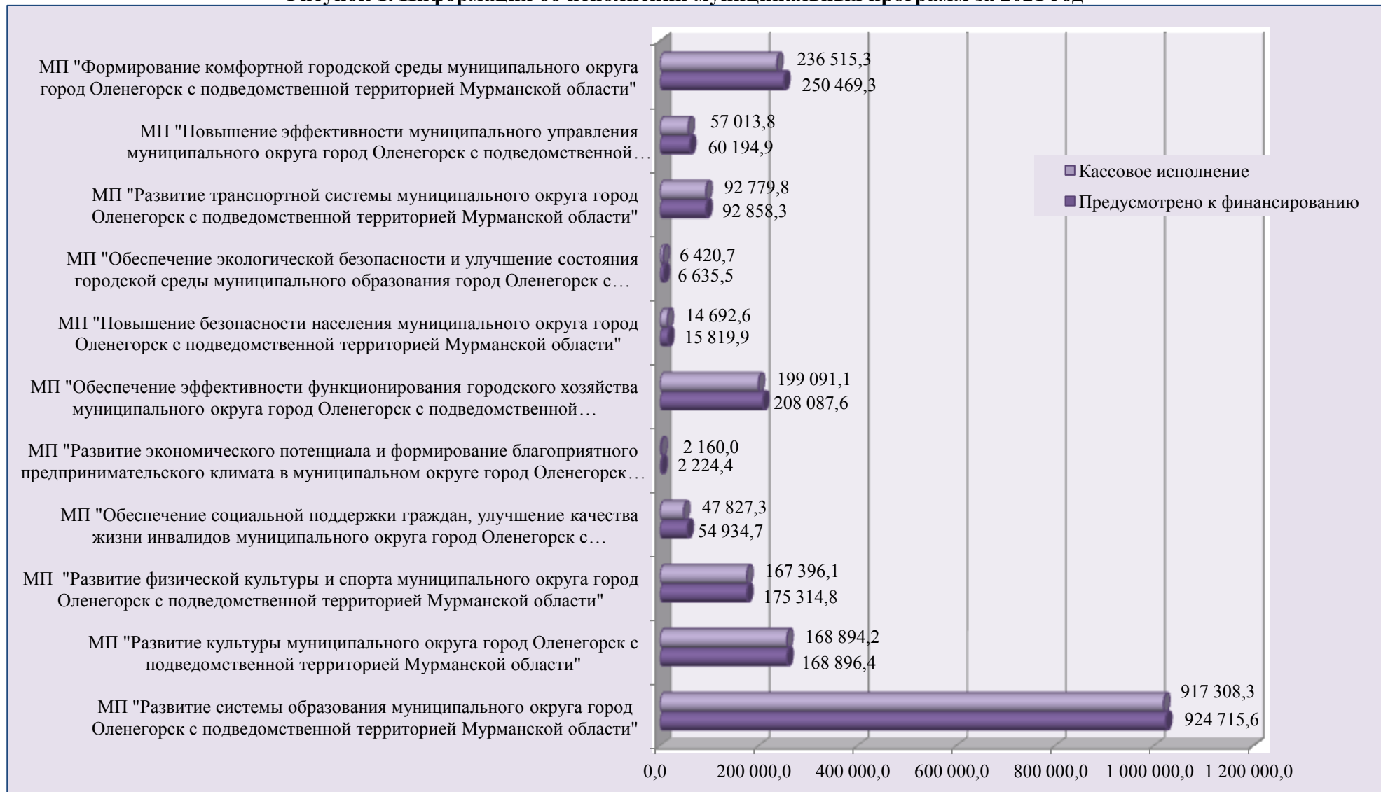
Рисунок 1. Информация об исполнении муниципальных программ за 2021 год