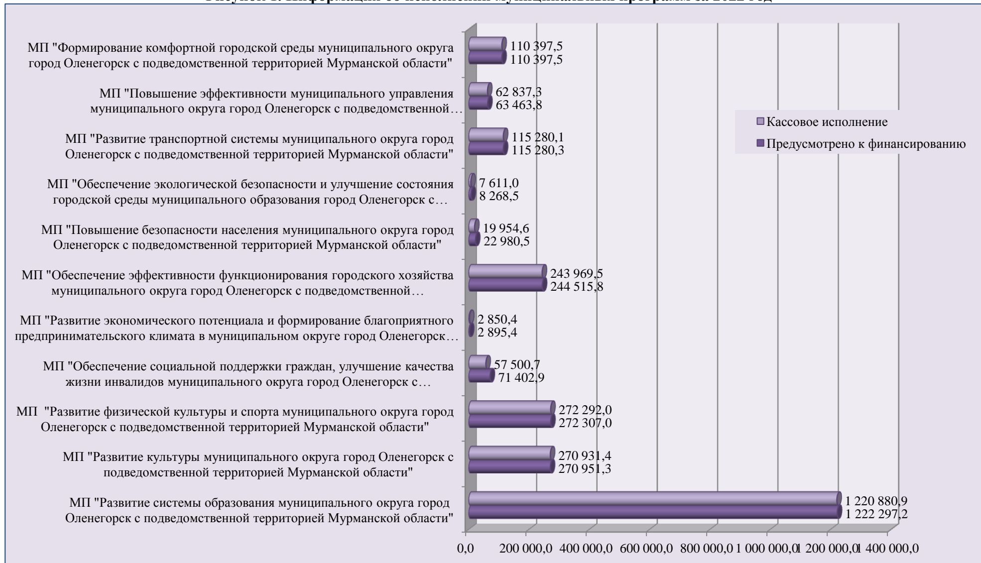
Рисунок 1. Информация об исполнении муниципальных программ за 2022 год