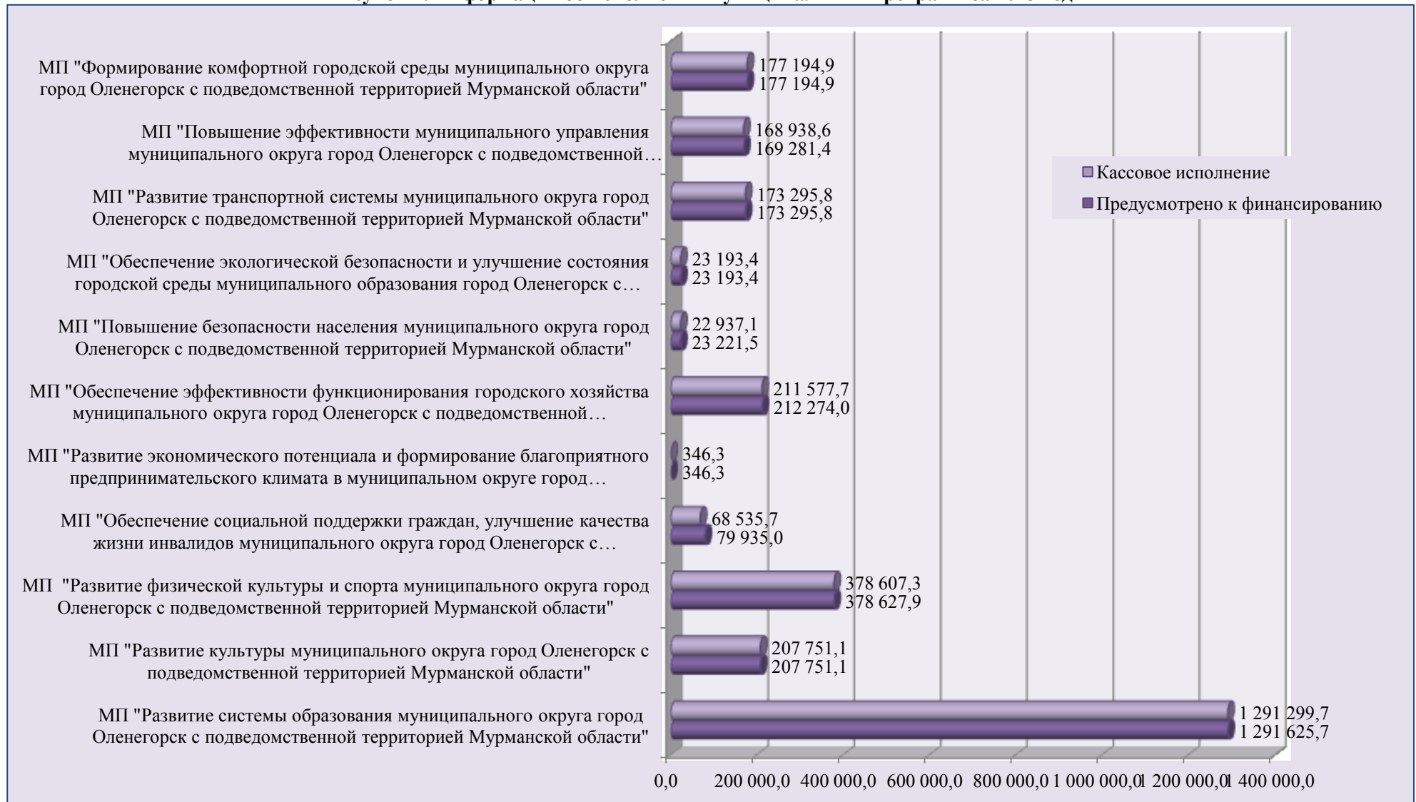
Рисунок 1. Информация об исполнении муниципальных программ за 2023 год